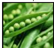
Grašak sa povrćem